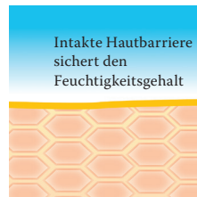
Intakte, schützende Hautbarriere mit Linolsäure-reichen Lipiden.

Um diesen Barrierestörungen sowie Fett- und Feuchtigkeitsdefiziten trockener