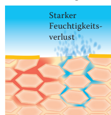
Lipidverlust führt zu einer gestörten Hautbarriere: Die Haut verliert viel Wasser und trocknet aus.

Haut entgegenzuwirken und sie vor weiteren Schäden zu schützen, ist daher sowohl eine regelmäßige Pflege als auch eine schonende Reinigung unerlässlich.