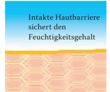
Intakte, schützende Hautbarriere mit Linolsäure-reichen Lipiden

Weitere Informationen stehen für Sie bereit unter www.linola.de