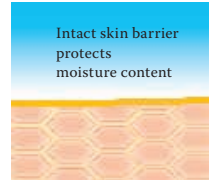
Intact protective skin barrier with lipids rich in linoleic acids.

structural lipids, rich in linoleic acid, which are situated between the corneocytes connecting them flexibly with each other. This forms a structure like a brick wall which denies bacteria and harmful substances a chance to penetrate our skin. However, if the structural lipids are removed by too frequent washing, showering or swimming or if they are not produced in sufficient quantities, as is the case in ageing skin or atopic eczema, then the corneocytes become detached from each other and holes develop in the skin's protective barrier.