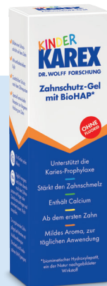
Kinder Karex Zahnschutz-Gel, 50 ml, PZN: 17308191