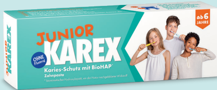
Junior Karex Zahnpasta, 65 ml, PZN: 17817283