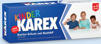
Kinder Karex Zahnpasta, 50 ml, PZN: 14299617